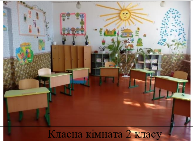
Класна кімната 2 класу