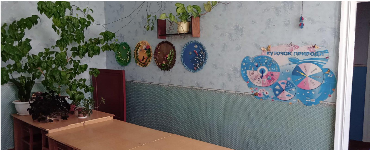
Внутрішній вигляд кімнат для дітей.