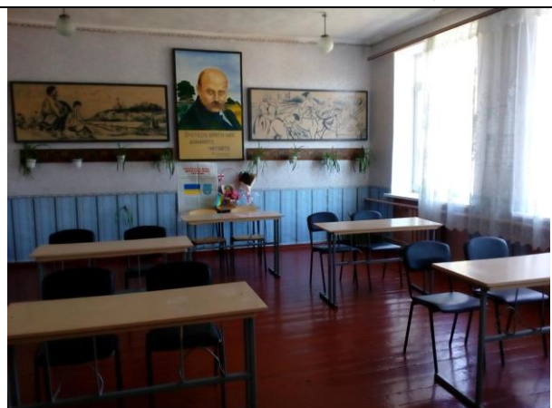
Кабінет української мови