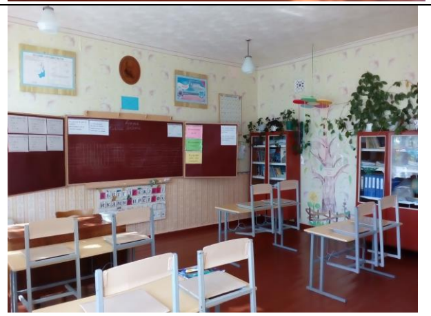
Класна кімната 4 класу