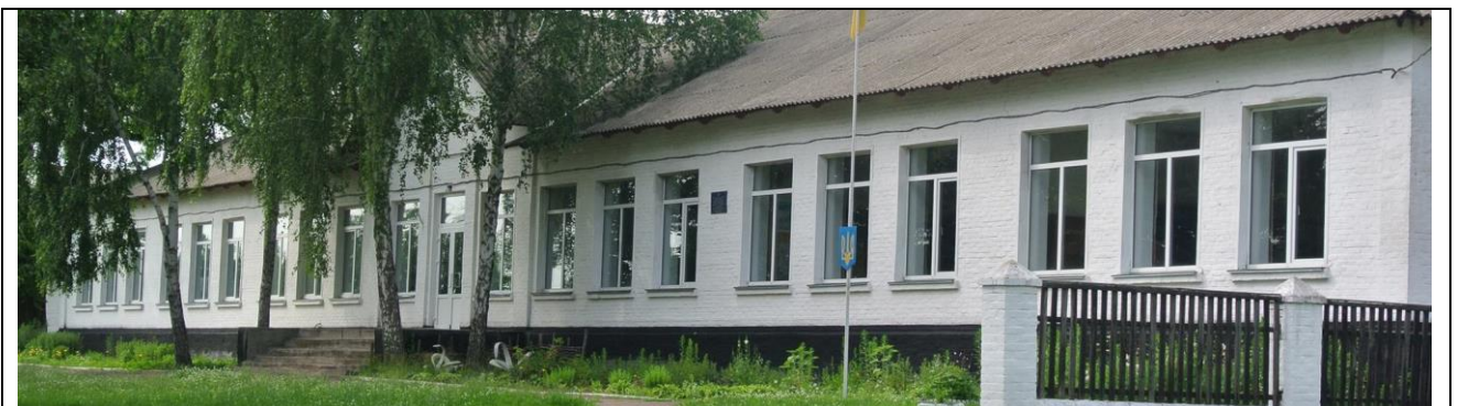
Приміщення в якій розташована дошкільна установа