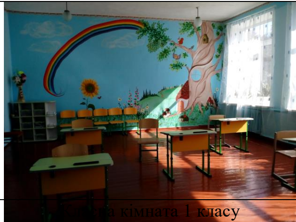
Класна кімната 1 класу