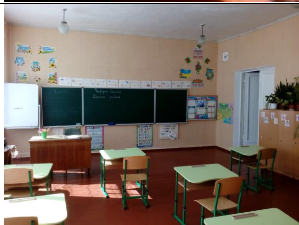
Класна кімната 3 класу